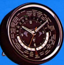
SOMMERKAMP Weltzeituhr QTR-24

Abmessungen: 370x157x350 mm Gewicht: 17 kg