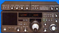
Sonderzubehör: FRT 7700 Antennen-Tuner FRV 7700C 140-170 MHz Converter FRA 7700 Aktive Zimmerantenne

Weich ein interessantes Hobby, die vielfältigen Funkdienste der Kurzwellen abzuhören: den Seefunk, Flugfunk, Polizeifunk, Amateurfunk, die Wetter- und Börsenachrichten und das Radioprogramm der entferntesten exotischen Länder im Direktempfang. Abmessungen: 334x129x225 mm Gewicht: 6,5 kg.